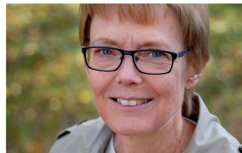
God Jul! önskar

Jag känner att vi går i takt med dagens utmaningar och att vi har en fortsatt viktig uppgift att fylla!