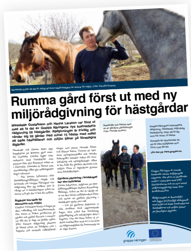
Exempel från höstens annonskampanj.

Kommunikation och marknadsföring om Greppa Näringens rådgivningen sker även via LRF och länsstyrelsernas kanaler som till exempel nyhetsbrev, sociala medier och tryckt material.