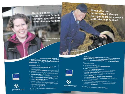
Exempel från höstens annonskampanj.

Under året har vi arbetat för att våra Greppaambassadörer lyfts fram på LRFs hemsidor och medlemssidor samt även internt inom LRF. Producerade artiklar har också återanvänts i Länsstyrelsernas publikationer.