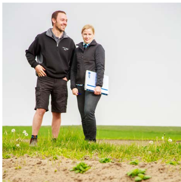
Greppa Näringens rådgivare är väl rustade inför besök hos lantbrukaren.

Läs mera om våra rådgivningar och underlagsmaterial på webbplatsen för rådgivare adm.greppa.nu .