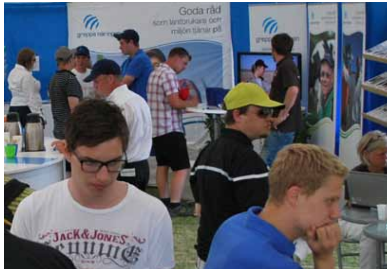
Det var full fart i Greppa Näringens monter under Borgeby Fältdagar.

Deltagande i Greppa Näringen-montrar arrangerade regionalt har skett vid VM i plöjning i Östergötland, Brunnbydagarna i Västerås och Logårdsdagen i Grästorp.