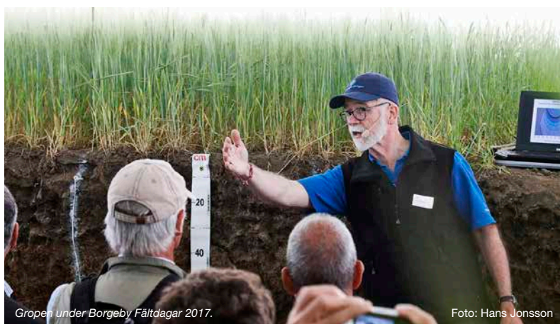
Gropen under Borgeby Fältdagar 2017.