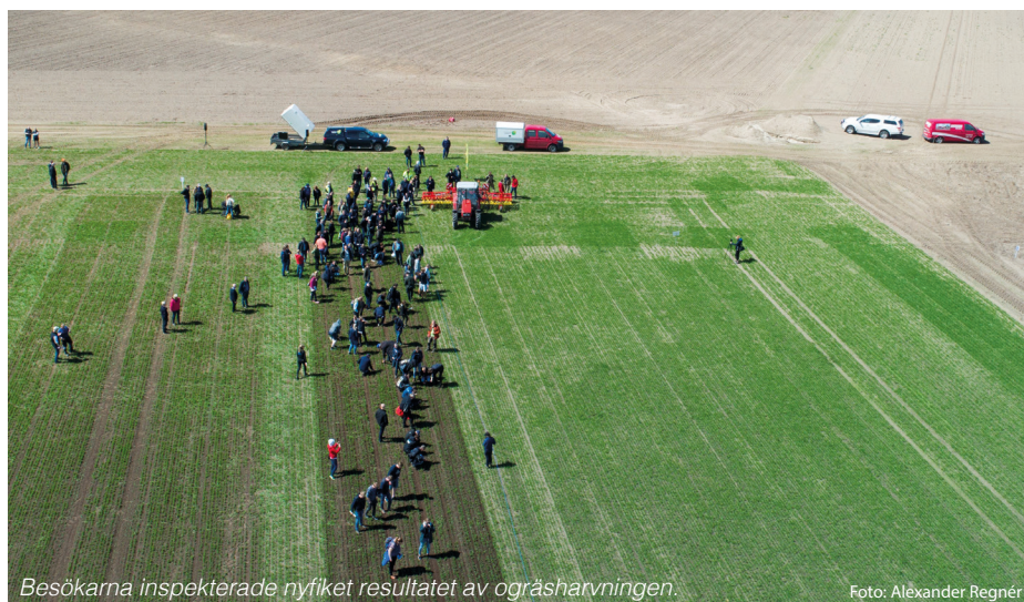
Besökarna inspekterade nyfikat resultatet av ogräsharvningen.

I slutet av maj samlades 200 lantbrukare, rådgivare och andra intresserade i Skepparslöv utanför Kristianstad för en dag om integrerat växtskydd, IPM. Bakom dagen stod Jordbruksverket tillsammans med Länsstyrelsen, HIR Skåne, Nordic Beet Research, Betodlarna och Lyckeby.