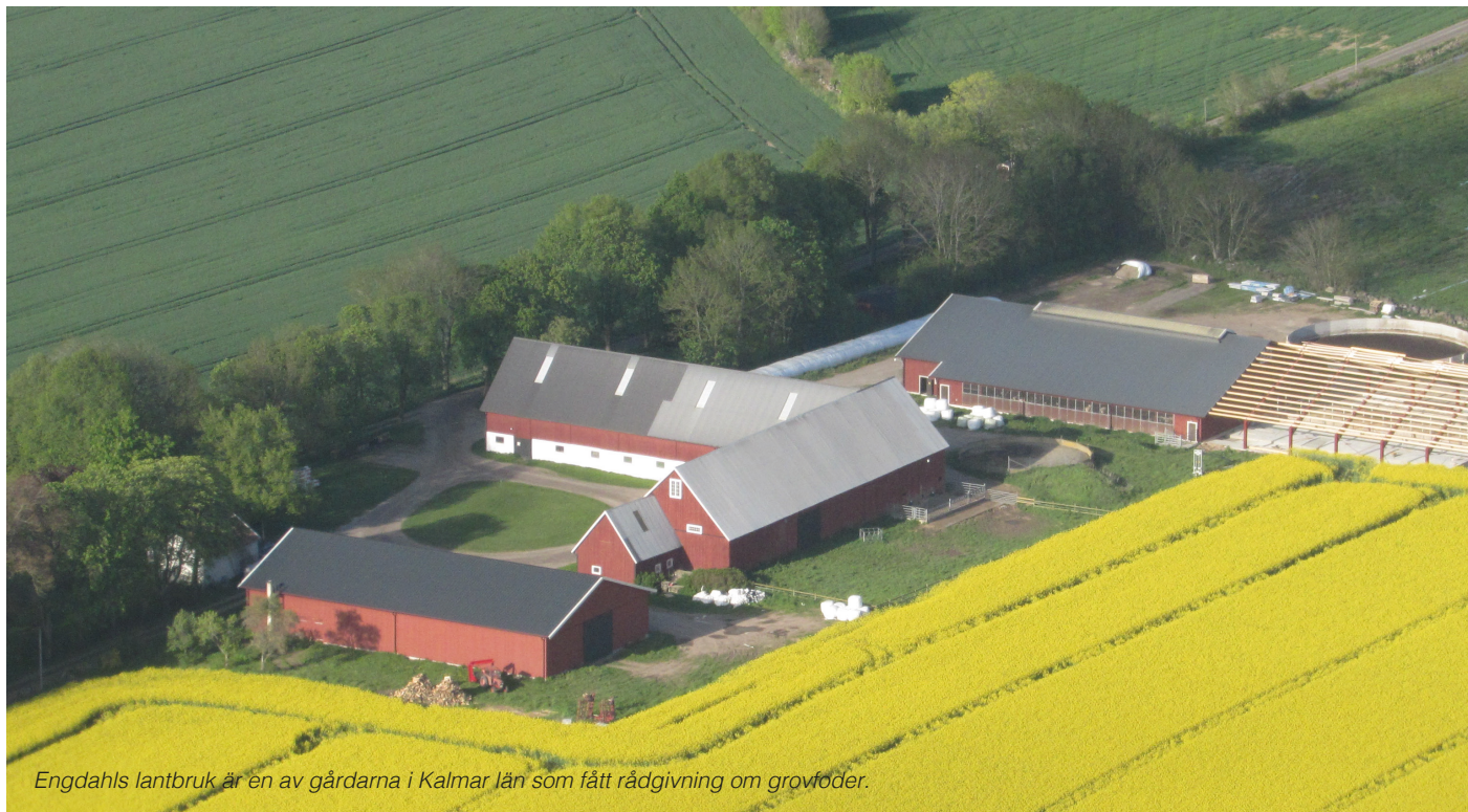
Engdahls lantbruk är en av gårdarna i Kalmar län som fått rådgivning om grovfoder.

Förra sommarens torra märks fortfarande i ladorna. Många lantbrukare har haft anledning att oroa sig över om fodret kommer att räcka till sina djur. Det har aktualiserat frågan om en effektiv grovfoderodling och en optimal utfodring.