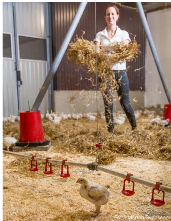
Isolera under golvytorna och tillsätt golvvärme i kycklingstallar så gödselytorna inte blir fuktiga. Placera även vatten- och foderautomaterna på bra platser för att undvika spill.

Luftrörelser och temperatur närmast gödselytan påverkar ammoniakavgången. Ett stillastående luftskikt blir mättat med ammoniak och en jämvikt uppstår där inte mer ammoniak kan avgå till luften. Rör sig luften så börjar avgivningen igen. Att täta öppningar mot kulvert med gummiduk gör att luftrörelserna minskar. För att undvika luftrörelser bör inte gödselrännan gå från varmt till kallare utrymme med öppen luftförbindelse. I fjäderfästall däremot minskar ammoniakavgången när gödseln torkar på gödselmattorna, så där kan luftrörelser i stallet vara till hjälp för snabb upptorkning.