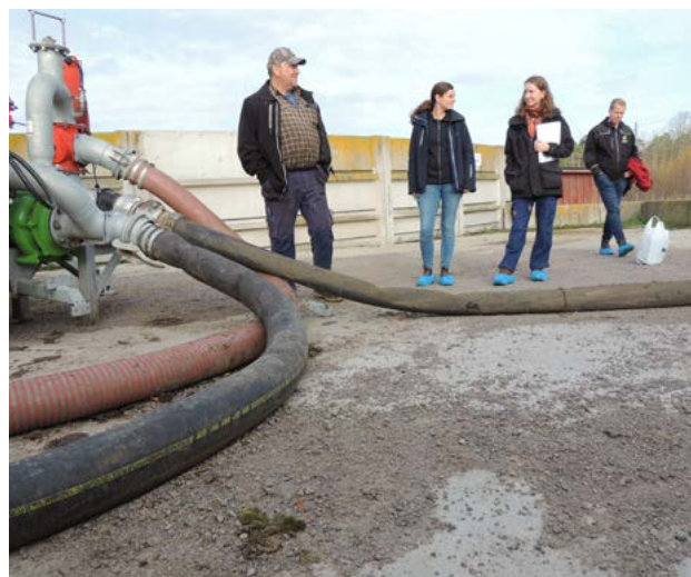
Deltagare på kursen Stallgödselspridning i teori och praktik ute i fält den 24 oktober utanför Mjölby.

Vi håller underlaget till Greppa Näringens rådgivningar uppdaterat på webbplatsen för rådgivare. Ungefär 20 av de 35 rådgivningssidorna på webbplatsen har fått nytt eller uppdaterat material under året. Läs mera om våra rådgivningar och underlagsmaterial på adm.greppa.nu/ . Vi har flera samarbeten med andra projekt inom Jordbruksverkets rådgivningsenhet, såsom Växtskyddscentralerna vilka hjälper oss med rådgivning om växtskydd, projektet Vattenhushållning håller i rådgivningar om vattenfrågor och Minskad energi- och klimatpåverkan, i rådgivningar om energikartläggning.