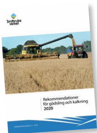
Rekommendationer för gödsling och kalkning 2020 är ett viktigt underlag för våra råd i Greppa Näringen