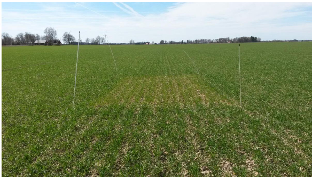
Nollruta vid Hasslösa

I år har vi lagt ut 14 nollrutor (ogödslade rutor) i höstvetefält hos sex lantbrukare i Västra Götaland. Vi mäter kväveupptaget dels i ogödslade rutor och dels i det övriga, gödslade fältet. På så sätt kan vi följa markens kväveleverans och beräkna hur mycket av gödlat kväve som tagits upp av grödan. Mätningarna gör vi i samarbete med Yara, som lånat ut en handburen N-sensor till oss på Greppa Näringen i Skara, Jordbruksverkets rådgivningsenhet. Yara gör samtidigt mätningar och skickar ut nyhetsbrev från kvävestegeförsök i höstvete varav 3 finns i Västra Götaland (Lidköping och Grästorp) och Dalsland (Mellerud). Försöken är delfinansierade av Jordbruksverket.