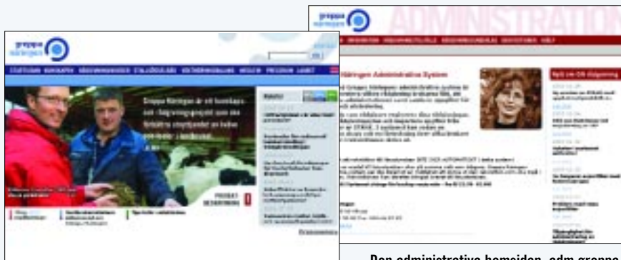
Den publika hemsidan, www.greppa.nu , hade ca 40 500 besökare under år 2002.