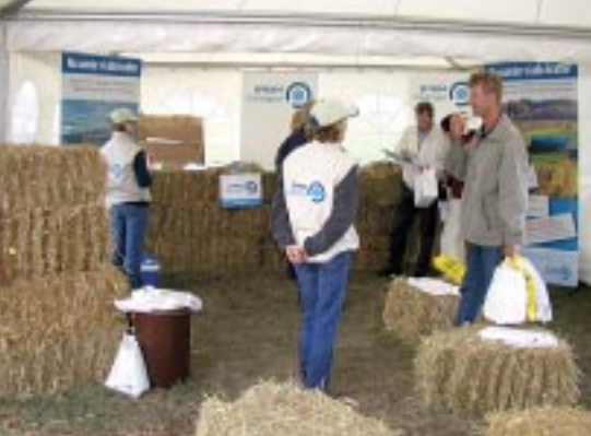
Greppa Näringen fanns på plats då fältdagarna på Hushållningssällskapet i Borgeby gick av stapeln i juni. Av de ca 2 000 besökarna fanns det vissa som fick nytta av Greppa Näringens papperspåsar i det regniga vädret.