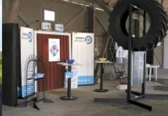
Betans dag hölls på Svenstorps gods i oktober. Greppa Näringens monter hade temat markpackning.

vid referensgruppens möten och att informera internt och externt om projektet. I utbyte har intressenten rätt att använda intressentskapet i Greppa Näringen i sin marknadsföring. I januari medverkade representanter ur projektledningen vid en informationsdag för lantbrukare anordnad av Lantmännen. Projektledningen träffade företrädare för DeLaval för att diskutera samarbetsformer vid ett tillfälle under sommaren.