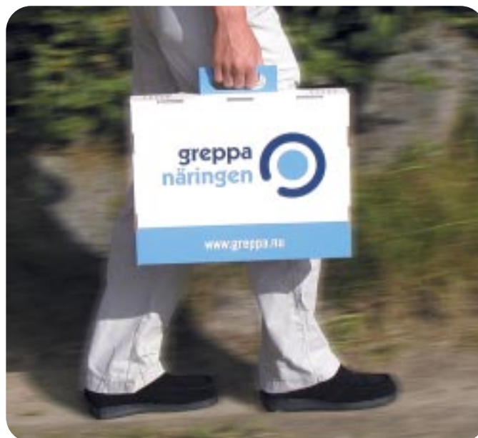
1 600 startpaket togs fram under året vilka delades ut till de lantbrukare som anmälde sig till projektet.

Kompetensuppbyggnad såväl bland rådgivare som bland lantbrukare utgör en viktig del av projektet. Ett exempel på projekt som utfördes under 2002 var att ta fram referensvärden som ett redskap för att tolka växtnärbalanser. Ett annat gällde att uppdatera och komplettera kapitlet om mjölk- och köttproduktion i uppslagsboken med fakta om kväveeffektiv uppfödning av rekryteringsdjur och ungnöt, och ett tredje ekonomiska åtgärder för kväveeffektiv mjölkproduktion. Två examensarbeten redovisades under året, vilka båda initierats av projektledningen och delvis finansierats inom projektet Greppa Näringen. Arbetena syftade till att förbättra lantbrukarens beslutsunderlag vid val av gödslingnivå.