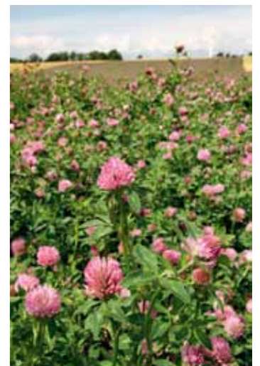
Rödklöver har kraftiga och djupa pålrötter och lämnar efter sig rotkanaler som ökar genomsläpligheten för vatten.