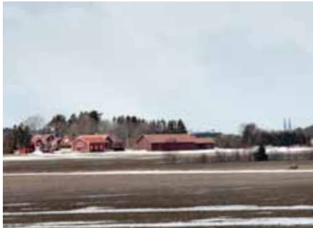
Uppsala länsstyrelse hoppas öka antalet medlemmar till 300 vid slutet av 2013.

Greppa Näringens nysatsning ger resultat. När siffrorna för januari 2011 för alla Greppa Näringens län var färdigräknade hade 144 medlemmar anslutit sig – det är den högsta siffran för januari sedan 2003 och mer än tre gånger så många som förra året. Något som bara styrker den fina trend som Greppa Näringen visar. Antalet medlemmar fortsätter att stiga och sista april var medlemsantalet uppe i 10 515.