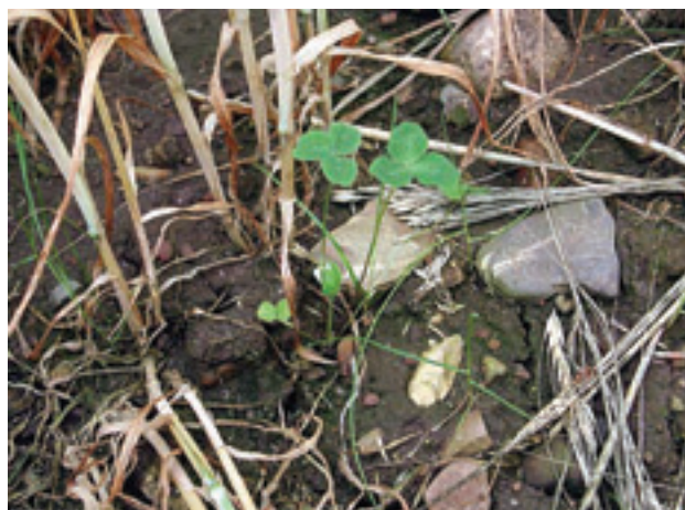
Rödklövern kräver ljus för att överleva konkurrensen från höstvetet.

Etablerar sig klöver bra och överlever under sommaren kan den växa sig kraftig under hösten. I ett försök i S Varalöv, utanför Ängelholm under år 2002, tillväxte rödklövern ca 700 kg/ha (torrsubstans) under hösten fram till 20 oktober. Klöverinblandningen gav mer än dubbelt så mycket kväve i grönmassan jämfört med att bara ha sått in gräs.