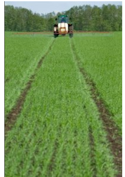
Tidigare var det framför allt riskerna vid själva sprutningen som diskuterades, men på senare år har risker för punktsläpp uppmärksammats mer.