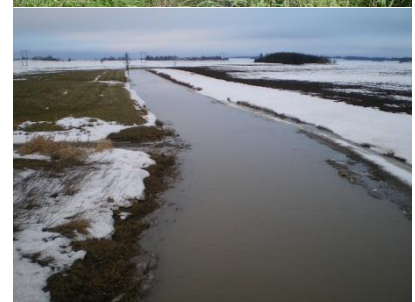
Vattenflöden, och därmed behovet av diken, varierar under året. Bilderna ovan visar samma plats på sommaren respektive vintern.