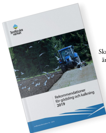
Skriften Rekommendationer för gödsling och kalkning 2019 är ett viktigt underlag för våra råd i Greppa Näringen

Vi har fortsatt att erbjuda kurser på distans för rådgivarna så att så många som möjligt av landets rådgivare ska kunna vara med. Femton av 23 kurser erbjöds på distans och en av dessa har även filmats så att den kan ses i efterhand. Den filmade kursen heter "Använd Terranimo för att räkna på markpackning". Distanskurserna är oftast kortare genomgångar på en till maximalt tre timmar medan kurserna där vi träffas är en eller två heldagar.